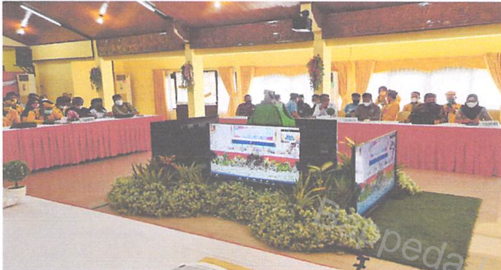
Gambar 3.6 Kegiatan FGD dengan tim ahli

Kegiatan FGD dengan Tim Ahli dengan Tim Pemerintah Kota Tarakan di Gedung Serbaguna.