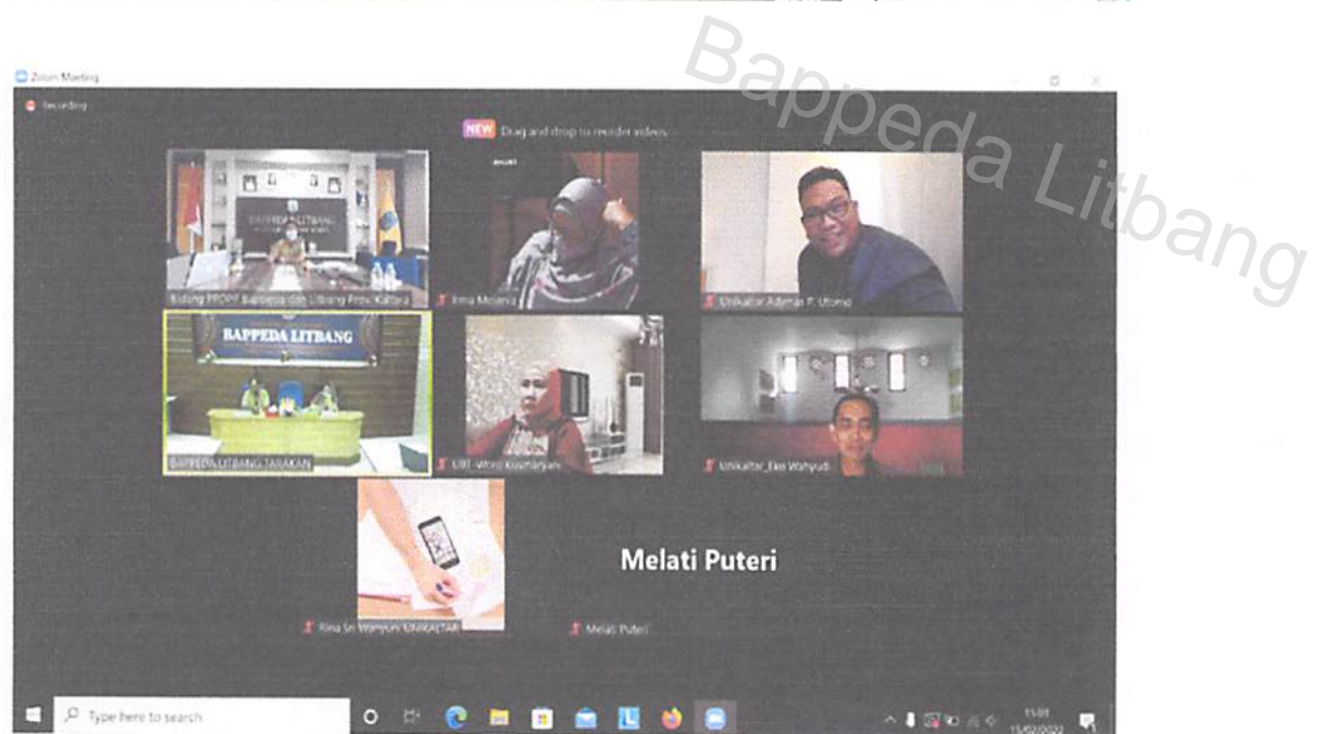
Gambar 3.5 Zoom meeting penghargaan perencanaan pembangunan daerah