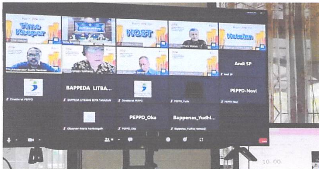
Gambar 3.4 Penetapan Kota Terbaik di Indonesia dalam perencanaan pembangunan Nasional